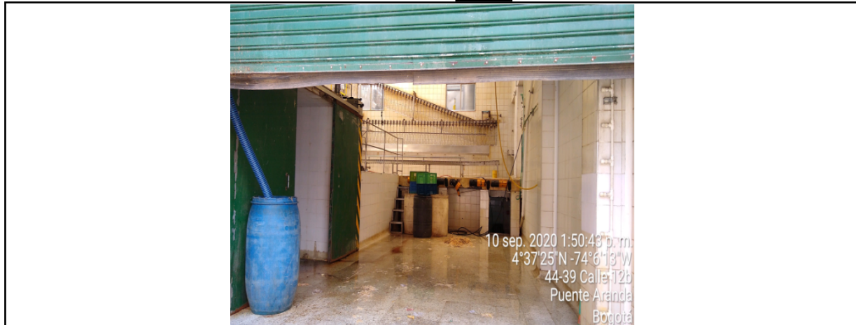
Fotografía No. 3 Entrada al área de descargue de las aves, donde se encuentra el pozo objeto de visita técnica.